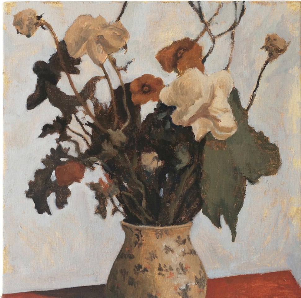
Lucas Fernando Rubly , Weathered Bouquet , 2025, oil and max on canvas, 25 x 25 cm